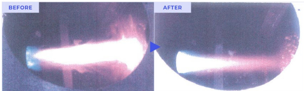
取り付け前の火炎状態画像